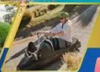
เล่นลuge ที่กรีนสทาวน์

AUCKLAND / ROTORUA / CHRISTCHURCH FOX GLACIER / FRANZ JOSEF / QUEENSTOWN พิกจ็อคแลนด์ 2 คืน / โรโตรัว 1 คืน / พิกคริสตเชิร์ช 2 คืน พิกฟรานซ์โจเซฟ 1 คืน / คริสตchurch 2 คืน