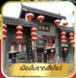
เมืองโบราณลือชือไว๋