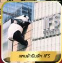
แพนด้าในตึก IFS