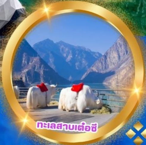
ทะเลสาบเต๋อซี