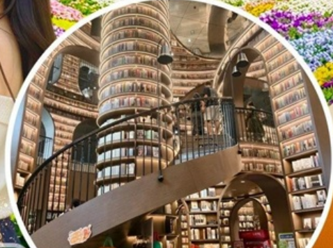
จงซูเก๋อ