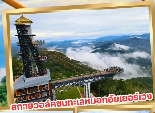
สกายวอล์คชมทะเลหมอกอัยเยอร์เวง

ร่วมโครงการ ลดหย่อนภาษี ลดสูงสุด 15,000.-