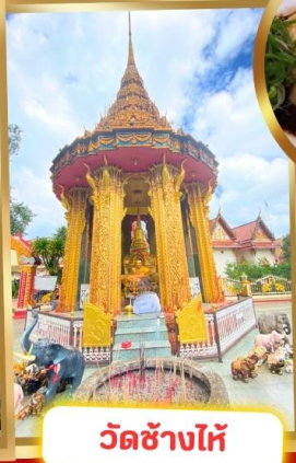
วัดช้างไห้