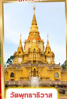
วัดพุทธาริวาส