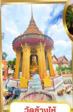
วัดช้างไห้