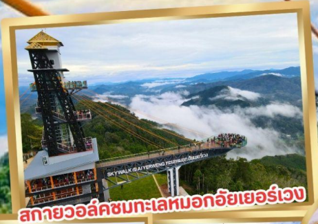
สกายวอล์คชมทะเลหมอกอัยเยอร์เวง

ร่วมโครงการ ลดหย่อนภาษี ลดสูงสุด 15,000.-