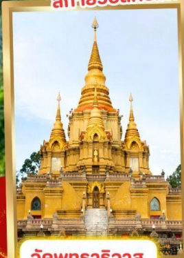
วัดพุทธาริवास