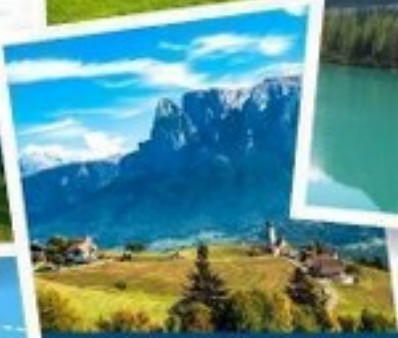
เมืองโบลซาโน