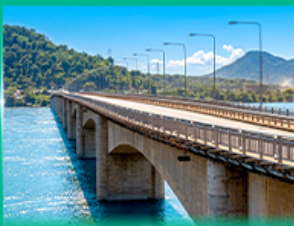
สะพานมิตรภาพลาว - สิบปัน