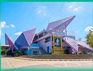
ด่านพรมแดนช่องเม็ก