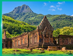
ปราสาทหินวัดพู