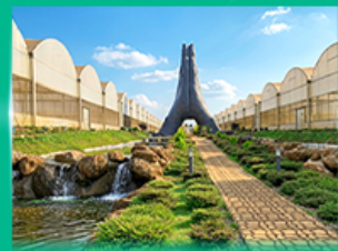
Agro Vege Farm