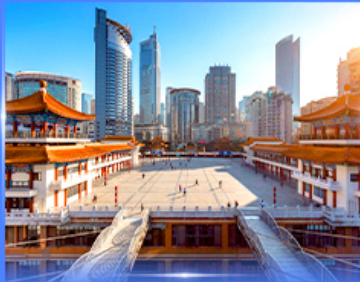
เซ็กอิน ตึกโควซิงโहा

OPTION ซีตี้วอร์ดซิ่ง ชมแพนด้า, POPMART, ซุปเปอร์, ถนนคนเดิน