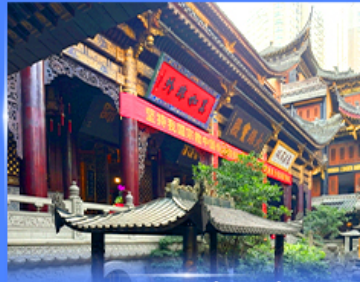
วพรวัดหลัวจัน ดงซิ่ง