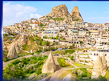
หุบเขาอูซึชัร คัปปาโดเกีย