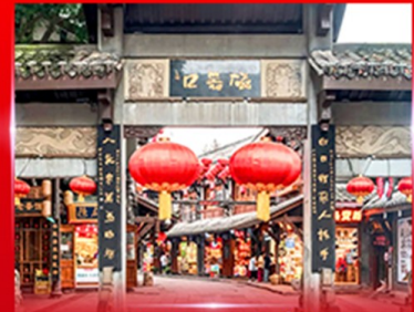
หมู่บ้านโบราณฉิวฉีโหว