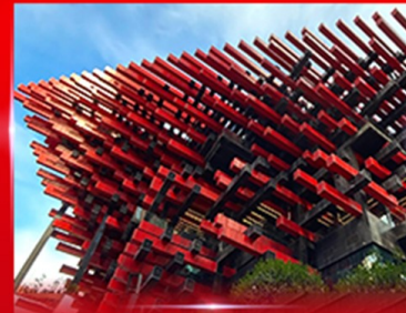
แลนด์มาร์คดิง ตึกตะเกียบ