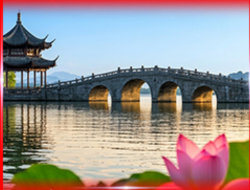
เที่ยวชมวิวกุหลาบสามสี