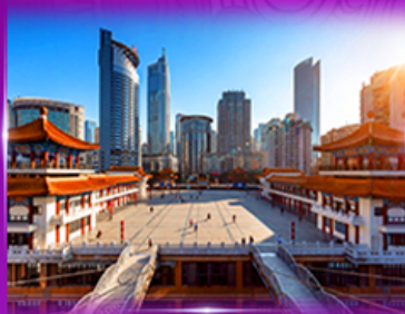
เข็ควิน ตึกโค่วซิงโห