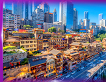
เข็ควินย่านต้ง หงหยาดัง