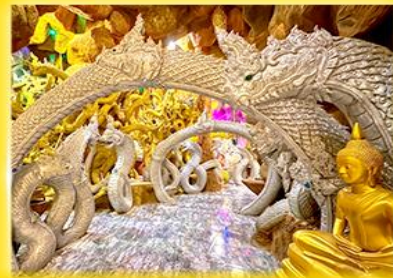
ชมภายในถ้ำพญานาค