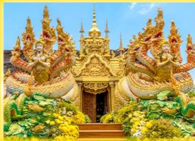
วัดมณีวงศ์ นครนายก