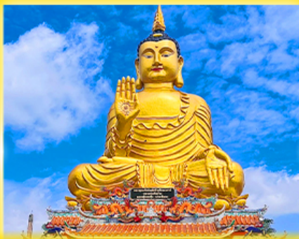
หลวงพ่อพันล้าน