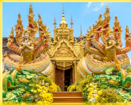
วัดมณีวงศ์ นครนายก