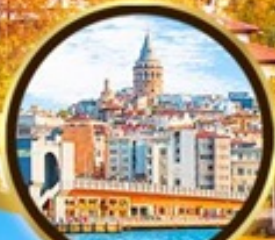
หอคอยกาลาตา