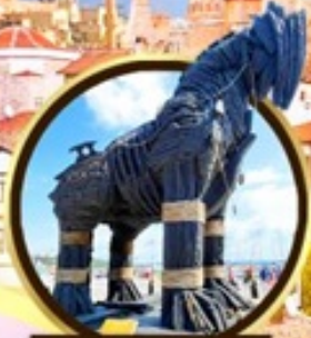
น้ำม้าเมืองทรอย