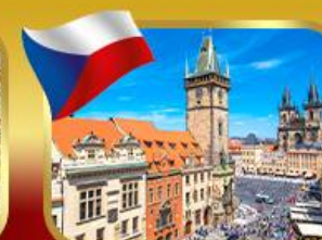
ชมวิวยุโรปจากเมืองปราก