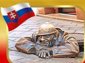
เข็ลอินคูลูมิลาเมืองบราติสลาวา