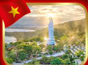
ชมพระกวนอิม วัดหลินอึ้ง