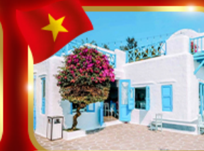
คาเฟ่สุดชิค ซานทรา มารีน่า