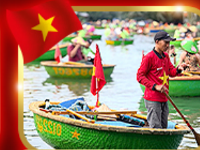
เรือกระด้ง หมู่บ้านกัมทาน