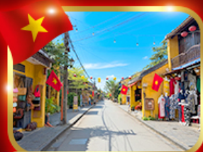
เมืองมรดกโลก ฮอยอัน