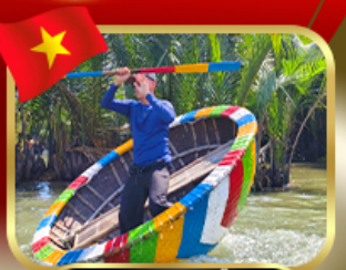
ล่องเรือกระดิ่งกัมพูชา