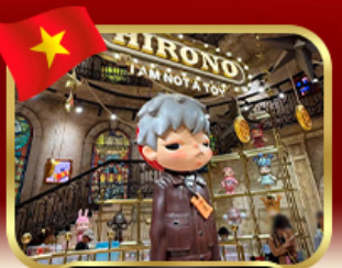
popmart บานาฮิลล์