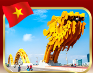
สะพานมังกร ดานัง