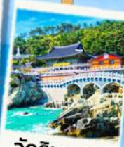
วัดริมทะเล