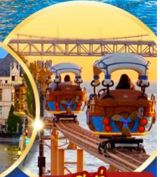
แถมฟรี! นั่งรถราง