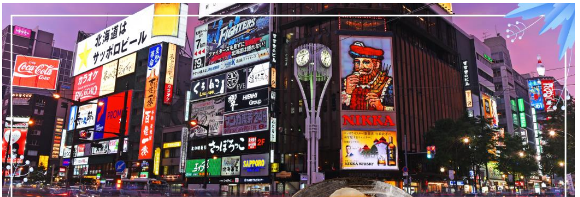
SUSUKINO ย่านซุซุกิโนะ

*กรณีที่หิมะตกความหนาไม่เพียงพอที่จะเล่นกิจกรรมได้ ขอปรับเปลี่ยนสถานที่เที่ยวเป็นดังนี้* นำท่านเดินทางสู่ เมืองบิเอะ (Biei) (ใช้เวลาเดินทางประมาณ 1.30 ชั่วโมง) เมืองเล็ก ๆ ล้อมรอบด้วยภูมิทัศน์ที่งดงามของภูเขาและทุ่งนาอันกว้างใหญ่ และในฤดูหนาวทัศนียภาพก็จะแตกต่างกันไป นำท่านสู่ น้ำตกชิราฮิเกะ (Shirahige Waterfall) หรือที่รู้จักกันในชื่อน้ำตกหมวดขาวแห่งเมืองบิเอะ 1 ใน 5 ของน้ำตกที่สวยงามที่สุดบนเกาะฮอกไกโด จากนั้นนำท่านชม สระอะโออิเคะ (Aoiike) หรือที่เรารู้จักกันอีกชื่อหนึ่งว่า "สระน้ำสีฟ้า (Blue Pond)" ห่างจากเทือกเขา Tokachi ประมาณ 2.5 กิโลเมตร นับเป็นแหล่งท่องเที่ยวที่เหมาะสมกับนักท่องเที่ยวสายสงบส่วนมากคนที่จะมาเที่ยวก็จะเป็นคนท้องถิ่นมากกว่านักท่องเที่ยวต่างชาติ นำท่านเดินทางสู่ เมืองซัปโปโร (SAPPORO) (ใช้เวลาเดินทางประมาณ 3 ชั่วโมง) นำท่านเดินทางสู่ ย่านซุซุกิโนะ (Susukino) นับเป็นย่านที่เต็มไปด้วยแหล่งบันเทิงที่โด่งดังมากที่สุดของเมืองซัปโปโร (Sapporo) อีกทั้งยังเรียกได้ว่าเป็นย่านบันเทิงที่ใหญ่ที่สุดในทางตอนเหนือของญี่ปุ่นที่เดียวละคะ บอกเลยว่าอยากมาบันเทิงใจยามค่ำคืนสัมผัสไลฟ์สไตล์แบบคนญี่ปุ่นแท้ๆ ต้องมาที่นี่ให้ได้เลยละคะ เพราะเต็มไปด้วยร้านค้า บาร์ ร้านอาหาร ร้านคาราโอเกะ และตู้ปาจิงโกะรวมกว่า 4,000 ร้าน บางร้านนี้เปิดจนถึงเที่ยงเที่ยงคืน