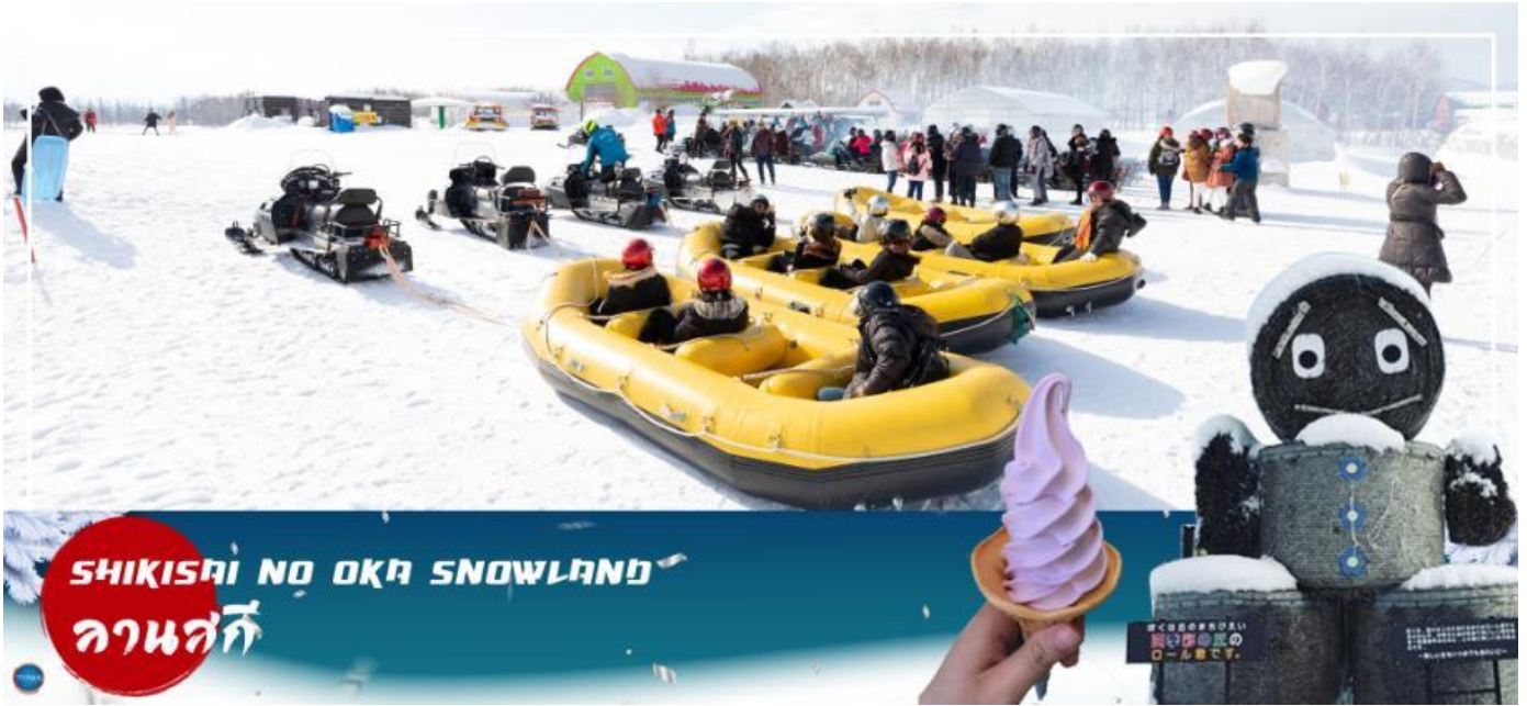
SHIKISAI NO OKU SNOWLAND ลานสกี

ลงจากเนินตามเนินเขาที่กำหนด และยังมี Banana Boat ที่ลากด้วยสโนว์โมบิลที่ลากซิกแซกตามสันเนินสร้างความสนุกสนานตื่นเต้นได้มากเลยทีเดียว และ Sled สำหรับพาหะส่วนตัว ที่ไหลลงจากเนินสูง (**หมายเหตุ ราคาไม่รวมค่าเล่นกิจกรรมต่างๆ ค่าเช่าชุดและอุปกรณ์ กรณีลานสโนว์เวิลด์ปิด บริษัทสงวนสิทธิ์ นำลูกค้าไปลานสโนว์เวิลด์อื่นแทนได้ตามความเหมาะสมกับสถานการณ์)