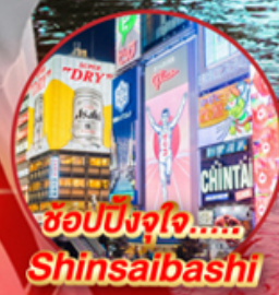
ช้อปปิ้งใจ..... Shinsaibashi