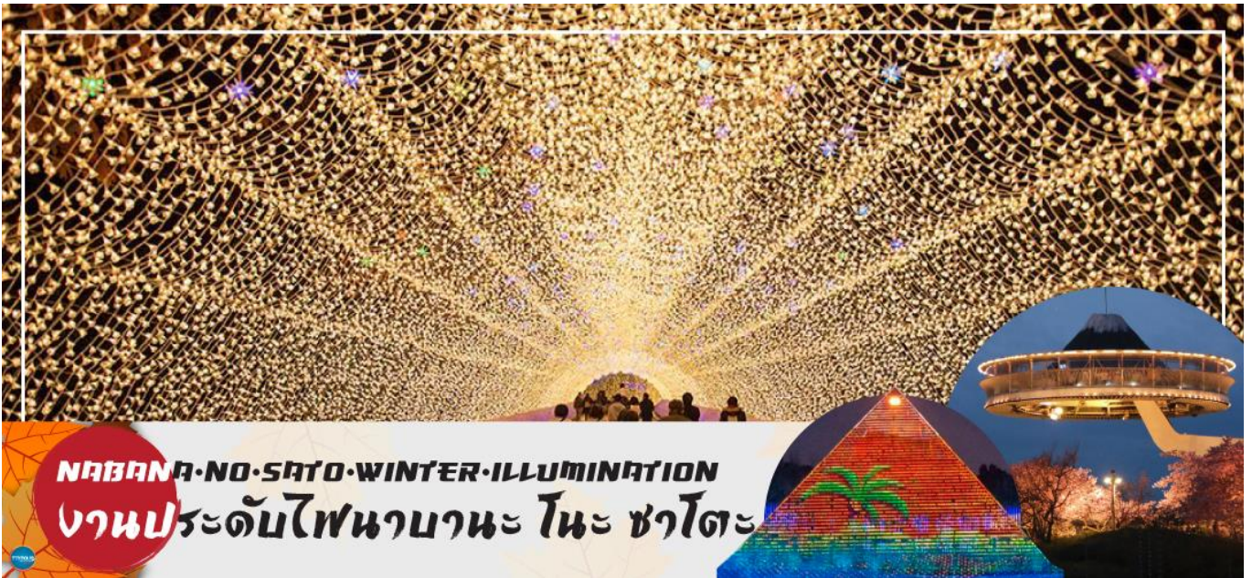
นาคานา-โน-ซาโต-วินเทอร์-อิลลูมินาชัน งานประดับไฟนาบะ โนะ ซาโตะ เป็น อีสาระรับประทานอาหารเย็นตามอัธยาศัย ที่พัก THE B NAGOYA หรือเทียบเท่าระดับเดียวกัน

นำท่านชม งานประดับไฟฤดูหนาว ณ หมู่บ้านนาบะ โนะ ซาโตะ (Nabana no Sato) เป็นธีมพาร์คสวนดอกไม้ ที่มีทุ่งดอกไม้ให้ชมตลอดทั้ง 4 ฤดูกาล สามารถเที่ยวได้ตลอดทั้งปี ไฮไลท์!!! การประดับไฟขนาดใหญ่ที่สุดในญี่ปุ่น จะมีในช่วงฤดูใบไม้ร่วงตลอดจนถึงปลายฤดูหนาว (กลางเดือนตุลาคม-เมษายน) จะได้รับความนิยมมากเป็นพิเศษ เนื่องจากมี การแสดงไฟในหลากหลายรูปแบบ ไม่ว่าจะเป็น อุโมงค์แสงไฟ (Tunnel of Light) หรือ การประดับไฟในน้ำ (Water Illumination) อีสาระให้ท่านได้เพลิดเพลินกับอลังการงานประดับไฟที่ไม่ว่าจะหันไปทางไหนก็มีมุมให้เก็บภาพประทับใจกลับไปอย่างมากมาย