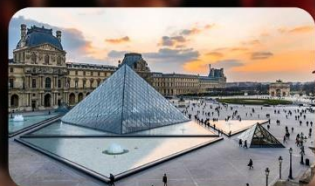
เข้าชมพิพิธภัณฑ์ลูฟวร์