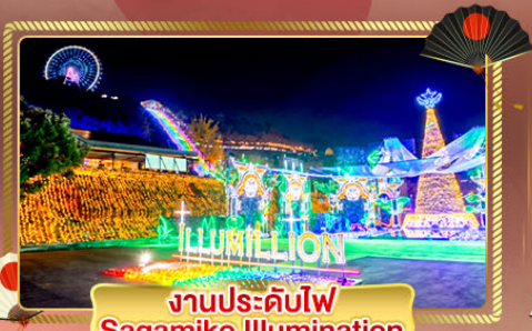
งานประดับไฟ Sagamiko Illumination