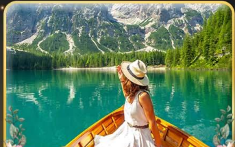
พายเรือทะเลสาบ Braies