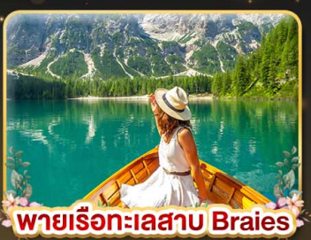
พายเรือทะเลสาบ Braies