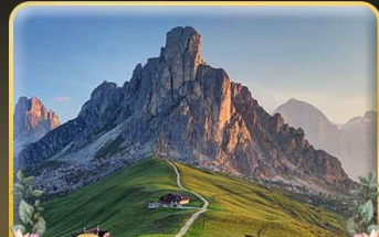
เยือน Passo Giau