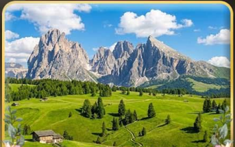
ชมวิวลังการ alpe di siusi