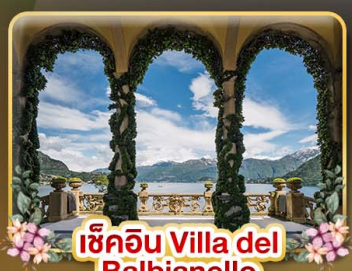
เชคอิน Villa del Balbianello

ที่สุดของธรรมชาติแห่งอิตาลี ทิวเขา ทะเลสาบ ความงามแห่งโดโลไมท์