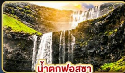
น้ำตกฟอสซา