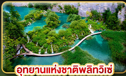
อุทยานแห่งชาติพลิตวิเช่