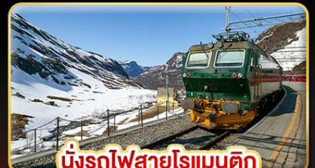
นั่งรถไฟสายโรแมนติก “พร้อมสปา”