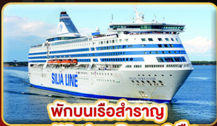
พักบนเรือสำราญ แบบ Window Room 2 คืน