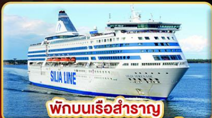
พักบนเรือสำราญ แบบ Window Room 2 คืน