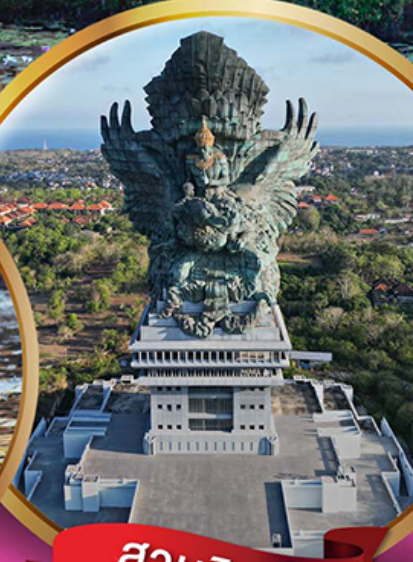
สวนวิษณุ