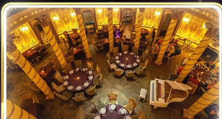
ทานอาหารสุดหรู ภัตตาคาร Turandot