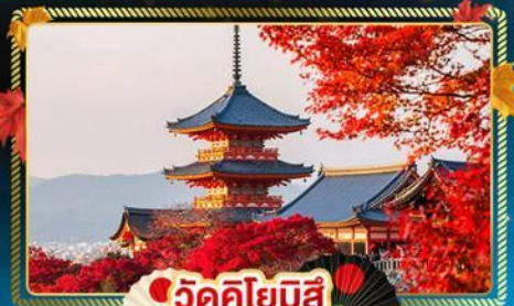
🍁 วัดคิโยมิซึ