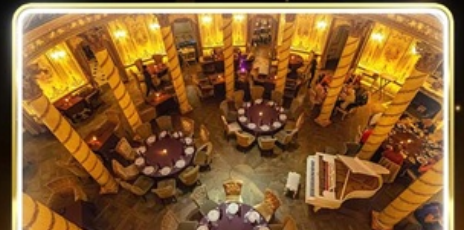
ทานอาหารสุดหรู ภัตตาคาร Turandot