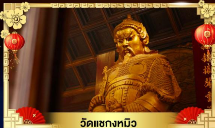
วัดแขกหมิว

หมุนกังหันน้ำโชควัดแขก ส่วนสนุกดิสนีย์แลนด์เต็มวัน