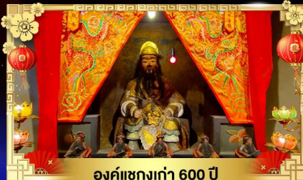
องค์แขกเก่า 600 ปี