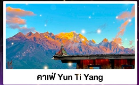
กาแฟ Yun Ti Yang