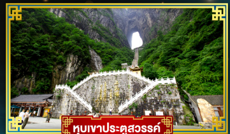
อุทยานประวัติศาสตร์