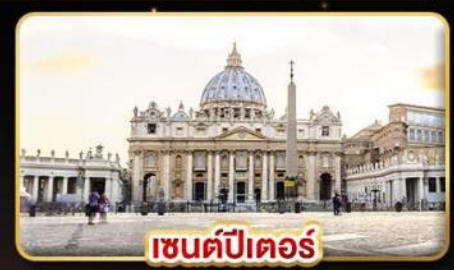
เซนต์ปีเตออร์