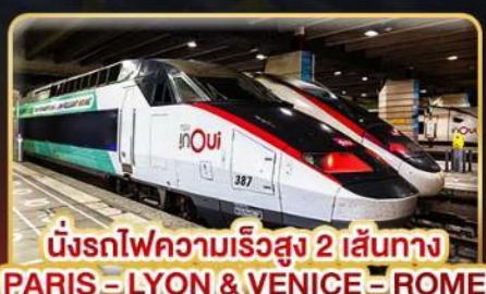
นั้งรถไฟความเร็วสูง 2 เส้นทาง PARIS - LYON & VENICE - ROME

เดินทาง : 11-20 ก.พ. 68 / 15-24 มี.ค. 68 05-14 เม.ย. 68 / 29-08 พ.ค. 68