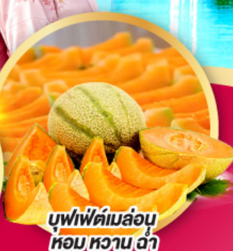
บุฟเฟ่ต์ผลไม้หอมหวาน ฉ่ำ