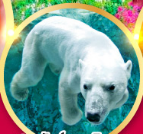
สวนสัตว์อาซาฮิยามะ