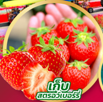
เก็บ สตรอว์เบอร์รี่