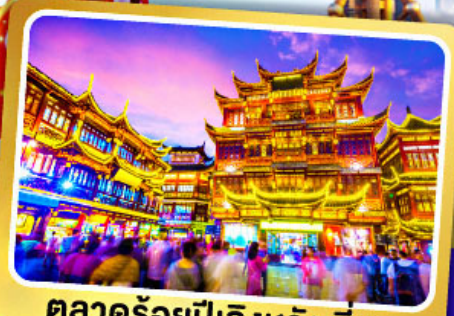
ตลาดร้อยปีเจิ้งหวังเมี่ยว