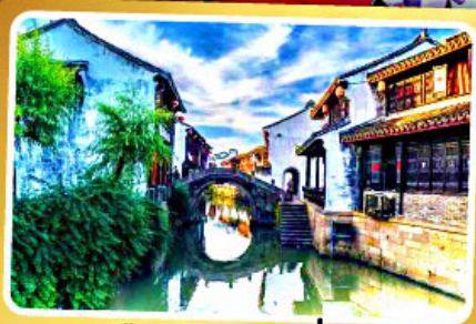
เมืองโบราณเยี่ยเหอ