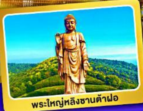
พระใหญ่หลิงซานต้าฝอ