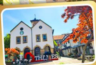
เกมส์ทาวน์