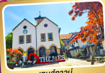
เทมส์ทาวน์