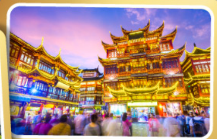
ตลาดร้อยปีเจียงหวงเมี่ยว

สนุกสนานไปกับเครื่องเล่น Shanghai Disneyland เต็มวัน