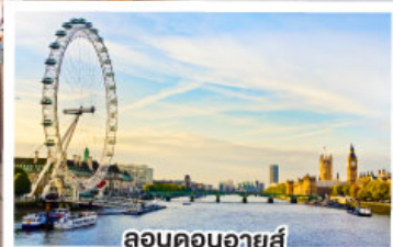
ลอนดอนอายส์