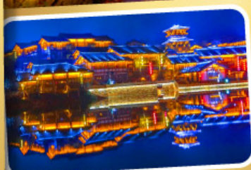
Oriental Salt Lake City