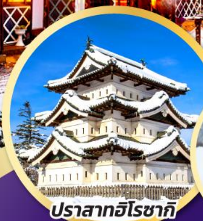
ปราสาทฮิโรซากิ