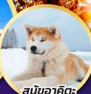
สุนัขอาคิตะ