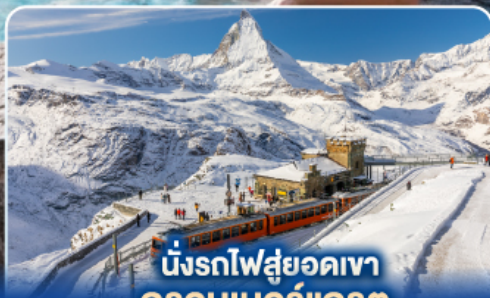
นั่งรถไฟสู่ยอดเขา กรอนเนอร์แกรต