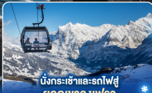
นั่งกระเช้าและรถไฟสู่ ยอดเขาจุงเฟรา