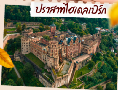
ปราสาทฮาเดคาบริก