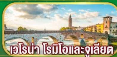
เวโรน่า โรมีโอและจูเลียต

เดินทาง 07-14 เม.ย. 69 / 02-09 พ.ค. 69 27 พ.ค. - 03 มิ.ย. 69 / 17-24 มิ.ย. 69 22-29 ก.ค. 69 / 11-18 ส.ค. 69 16-23 ก.ย. 69