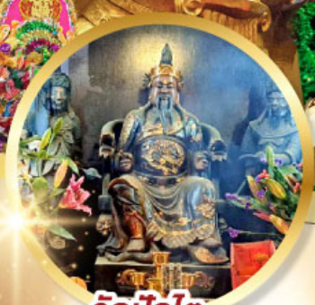
วัดปิกโต

เสริมโชคลาภนำความรุ่งเรือง ทุกด้านของชีวิต