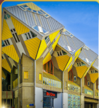
บ้านลูกเต๋า โครคูบัส

“ล่องเรือหลังคากระจก” ชมกรุงอัมสเตอร์ดัม