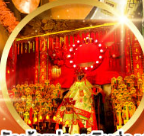
วัดเจ้าแม่กวนอิมฮ้องอำ