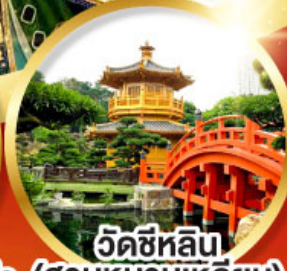
วัดซีหลิน