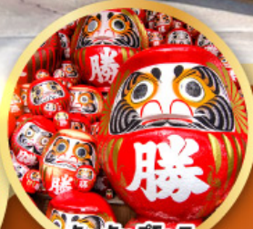
วัดคิตสึโฮจิ (วัดดามมะ)

ชมความงามของกำแพงหิมะ เส้นทางสายอัลไพน์ ทาคายามา (JAPAN ALPS SNOW WALL)