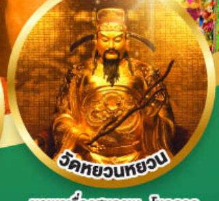
เจ้าแม่กวนอิมรับพลังบึ้ง