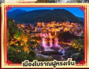
เมืองโบราณฝูหรงเจิ้น