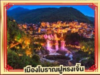
เมืองโบราณฟูหลงจั้น